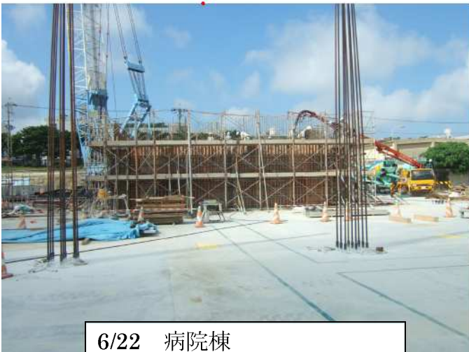
6/22 病院棟 (放射室コンクリート打設)