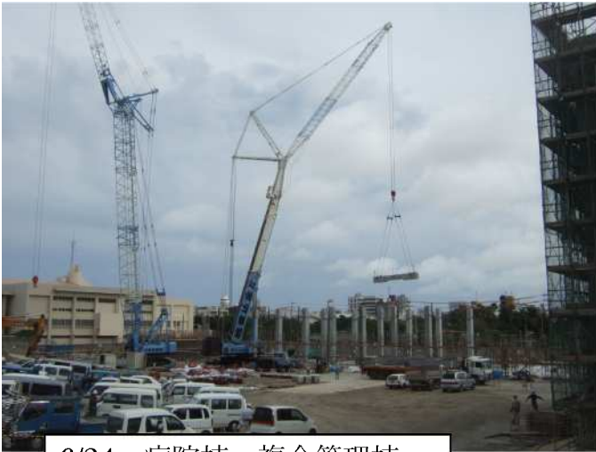
6/24 病院棟・複合管理棟 (PC建方工事)