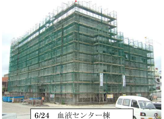
6/24 血液センター棟 (外装及び内装工事)