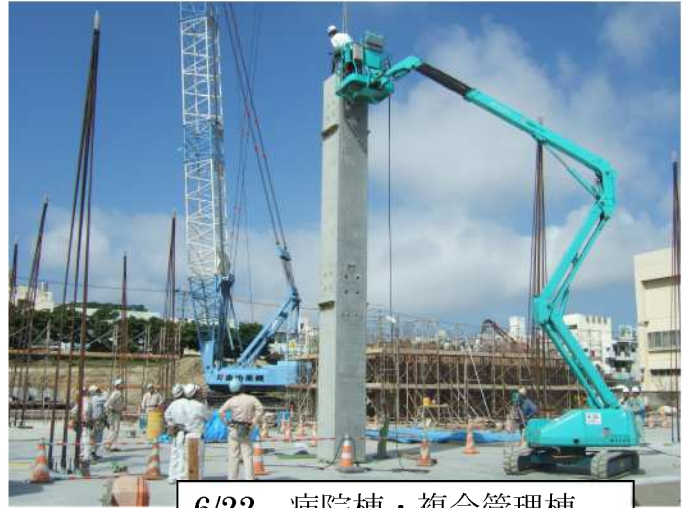
6/22 病院棟・複合管理棟 (柱：1本目施工)